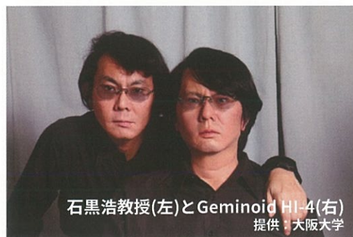
石黒浩教授(左)とGeminoid HI-4(右)

講師 石黒浩氏 大阪大学基礎工学研究科教授 (荣誉教授) ATR石黒浩特別研究所客員所長